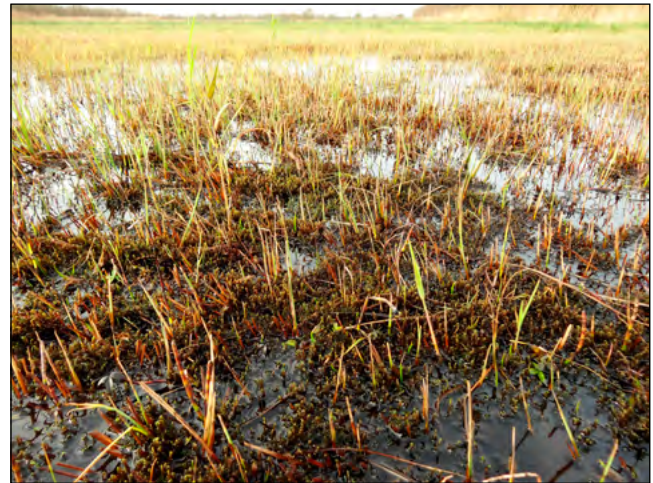
Figuur 6. Groen schorpioenmos. Twijzelermieden 23 november 2015.

Aan de hand van de vastgestelde verandering in de plantengroei op beide percelen in de Twijzelermieden kan geconcludeerd worden dat beide percelen duidelijk soortenrijker, natter en voedselarmer zijn geworden. Uiteraard werd dat aan de hand van een vergelijking van uitgevoerde vegetatiekarteringen in 1992, 2001, 2008 en 2016 in opdracht van Staatsbosbeheer ook al geconcludeerd. Op een andere manier naar dezelfde materie kijken is altijd nuttig en levert vaak nog andere inzichten op. Naast dat het met het Planteferbân van de FFF altijd 'tige noflik' inventariseren is! De belangrijkste conclusie van het onderzoek is dat natuurbeheer en ontwikkeling werkt! Mits in de juiste volgorde. Eerst een terrein inrichten op basis van de ecologische potentie en het daarna zorgvuldig beheren!