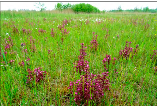
Figuur 4. Moeraskartelblad, na 1987 verschenen en inmiddels een zeer algemene soort in de Twijzelmieden. 28 mei 2016.

In 1987 werden in perceel A 201 soorten genoteerd en in 2019 waren dat er 212. Een bescheiden toename. Het wordt interessant als we een vergelijking maken tussen de ‘verdwenen’ en ‘verschenen’ soorten. Er zijn in gebied A in totaal 35 soorten verdwenen. Daar zaten drie Rodelijstsoorten bij, te weten Vlozegge, Rossig fonteinkruid en Hondsviooltje. Voor deze drie soorten geldt gelukkig, dat ze nog wel op andere plekken in de Mieden voorkomen. Een mogelijke verklaring voor het verdwijnen kan worden gezocht in het feit dat het gebied veel natter is geworden. Hierdoor zijn de voormalige groeiplaatsen van Vlozegge en Hondsviooltje mogelijk te nat geworden voor deze soorten. Een verklaring voor het verdwijnen van Rossig fonteinkruid kan worden gezocht in staken van