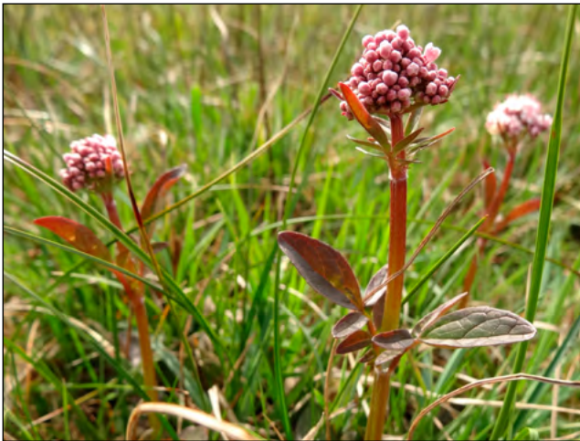
Figuur 5. Kleine valeriaan. Twijzelermieden 24 april 2015.

Een aspect waarmee bij het schrijven van dit artikel geen rekening is gehouden, is de bedekking van de aangetroffen planten. Van sommige soorten zoals Kleine valeriaan (figuur 5), die sinds 1950 in Nederland zeer sterk is achteruitgegaan, is de bedekking de afgelopen jaren in de Twijzelermieden flink toegenomen.