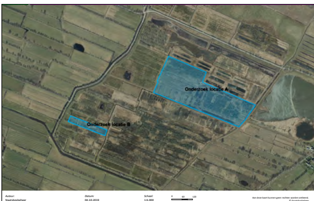
Figuur 1. Ligging van de onderzochte percelen.

Op de in 1987 onderzochte percelen (vanaf nu aangeduid als 'perceel A'; zie figuur 1) zijn